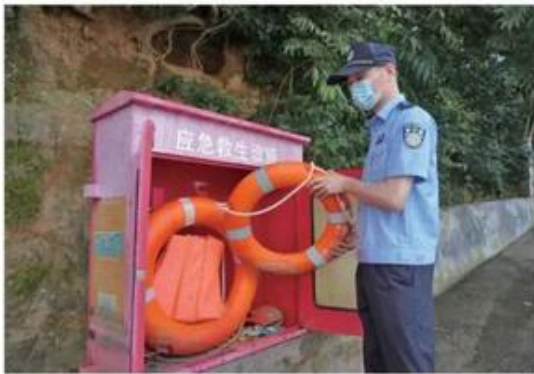
7月1日下午,台州市公安局黄岩分局院桥派出所民警来到秀岭水库开展防溺水设施安全检查,全力守牢夏季安全防线。图为民警检查水库附近的救生设备是否完好。

警方提醒老年人:天上不会掉馅饼,对于高科技理财产品要保持警惕;购买养生保健产品要通过正规渠道,认准保健品标识,对于所谓的高科技保健产品,要多渠道核实,不要轻信,以防被骗。