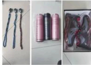
警方查获的“量子产品”

办案民警介绍,此类不法分子抓住老年人网络知识不足、辨识能力不强等特点,编造保健功能推销产品,推荐高回报投资理财,设置陷阱,诱导消费,骗