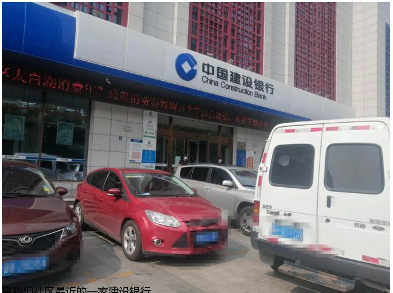
离我们社区最近的一家建设银行

因为，如果用微信或者支付宝转给他，都会有一定的手续费。办个手机银行，来回的转账就不会收取手续费了。