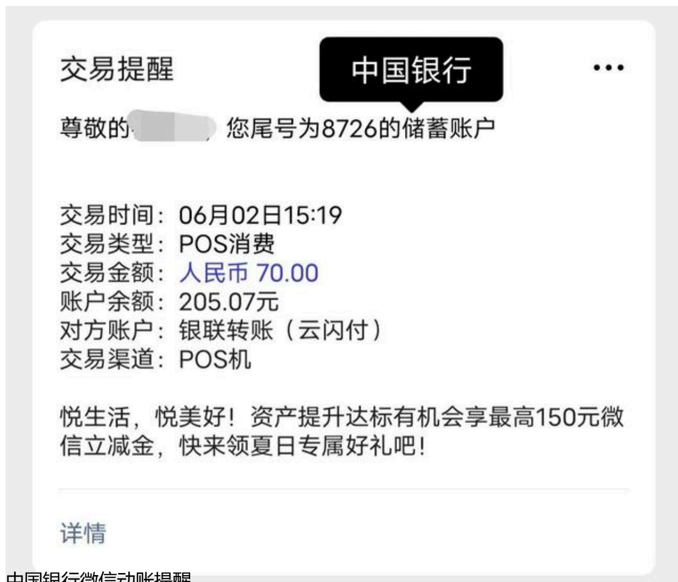
中国银行微信动账提醒

中国银行的微信动账提醒可以说是很全面的。几乎都显示出来了，银行卡对银行卡转账还能显示对方姓名。中国银行也是最早就有账户余额的显示的。