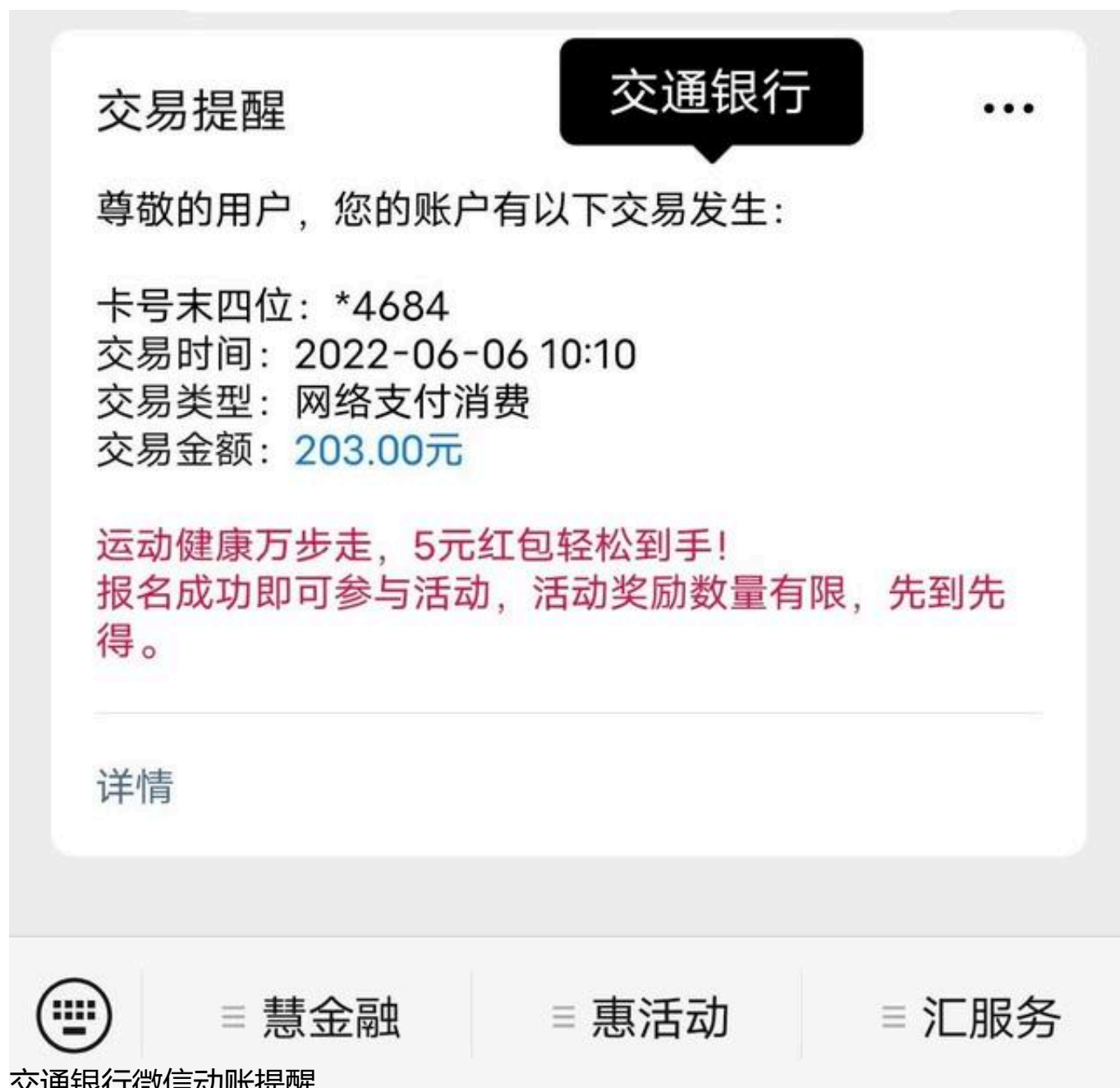
交通银行微信动账提醒

交通银行的微信动账提醒略显单薄，而且也没有余额的显示。还有一点，交通银行有免费的短信交易提醒，不过只在转出时有提醒，资金转入时没有。