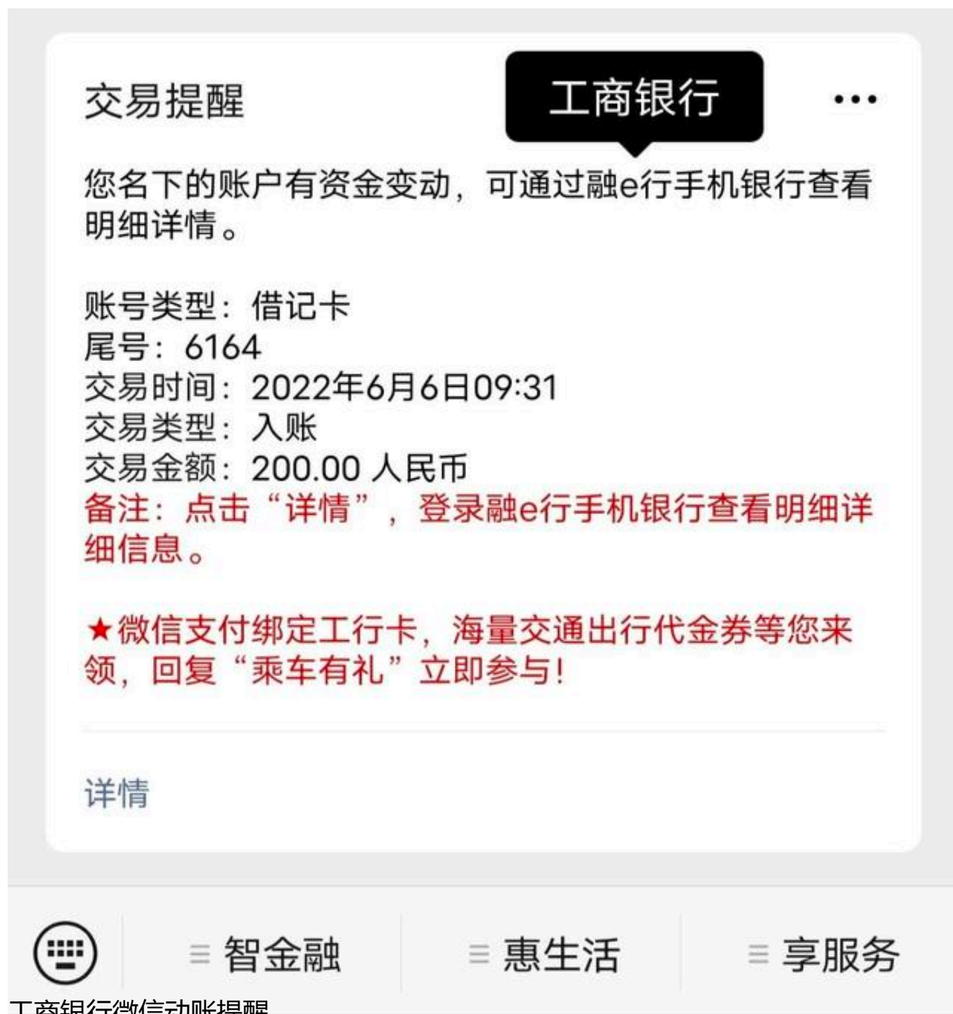
工商银行微信动账提醒

工商银行的交易提醒和交通银行类似，也不能显示余额。但是比起下app这样已经好很多了。