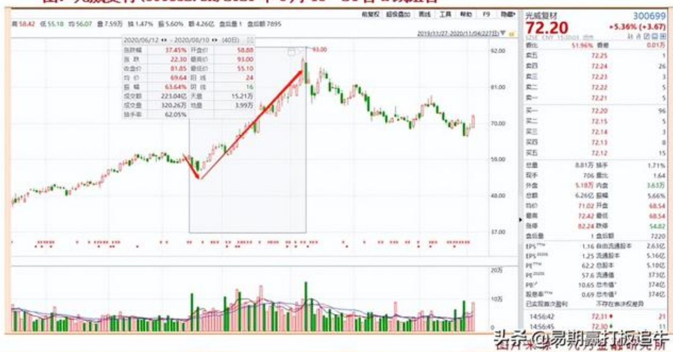
图：光威复材(600132.SH)2020年6月15—24日K线组合

以上，就是我们本期拆解的K线组合形态。我们认为，K线形态为市场多空力量对比真实写照，多空双方旗鼓相当的时候，K线多表现为十字星或小阴小阳线；一方强于另一方则表现为中阴或中阳线；一方大获全胜则表现为大阴或大阳线；出现长上影线为多转空，出现长下引线为空转多。