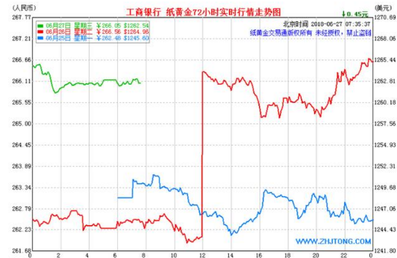
工行纸黄金走势图