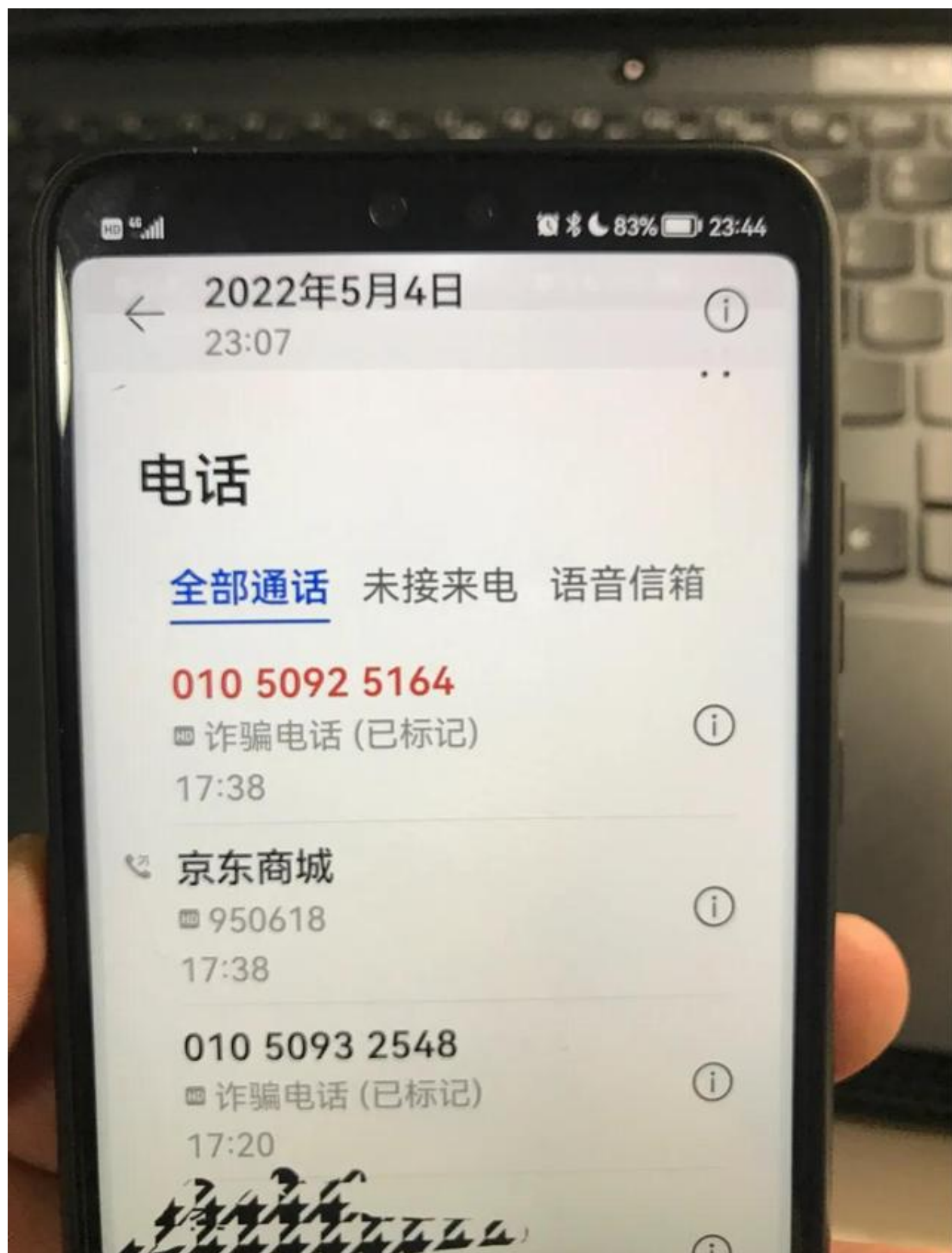
这个尾号是2548的电话开始差点让我信以为真，标注为诈骗电话是我后来标记的，