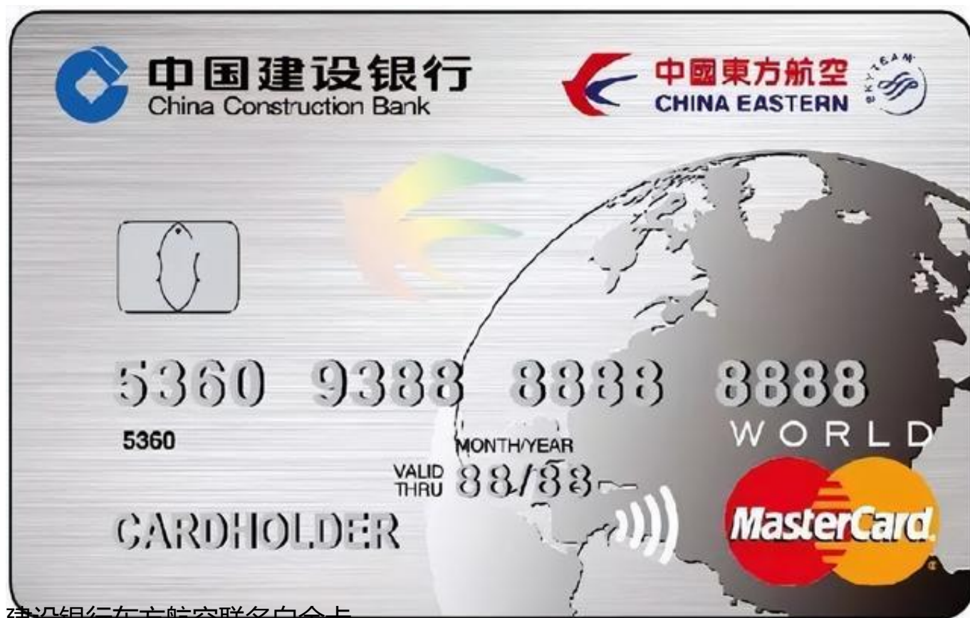
建设银行东方航空联名白金卡