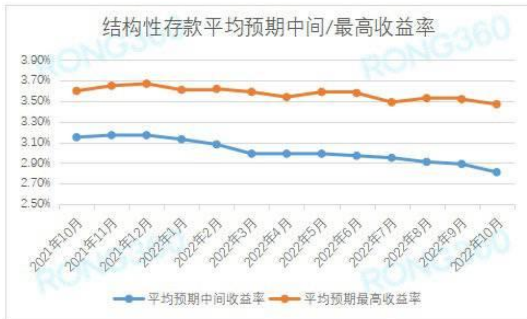
人民币结构性存款平均预期中间收益率、平均预期最高收益率走势

在发行结构性存款的4家国有银行中，10月份中国银行、交通银行平均预期最高收益率在3%以上，不同产品的预期最高收益率差别较大。