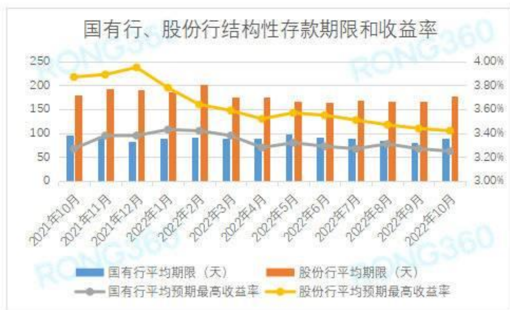
国有银行、股份制银行人民币结构性存款平均期限和平均预期最高收益率