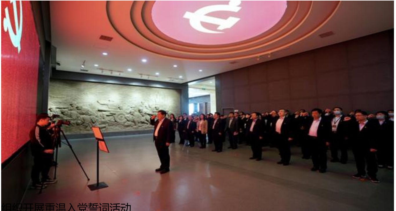
组织开展重温入党誓词活动

发展和党的建设重要论述作为重要内容，把学习研讨作为主要形式，推动理论学习走深走实。探索建立每周五政治理论固定学习日，在创新学习机制、学习内容、学习形式上狠下功夫，开展政治理论学习900余次，积极搭建学理论、强修养，学政策、强素质，学业务、强本领的学习平台。