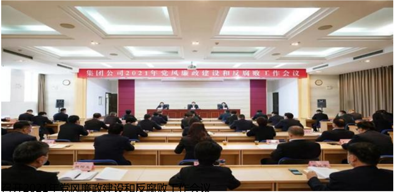
召开2021年党风廉政建设和反腐败工作会议